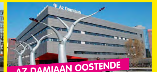
AZ DAMIAAN OOSTENDE VOORJAAR 2020