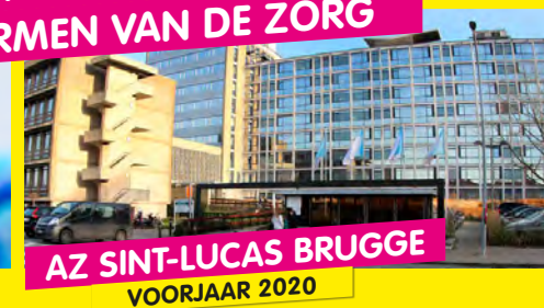
AZ SINT-LUCAS BRUGGE VOORJAAR 2020