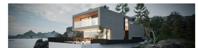
Virtueel Bouwen & Visualisatie