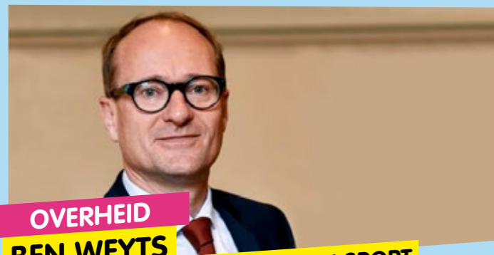
OVERHEID BEN WEYTS MINISTER VAN ONDERWIJS EN SPORT

"Bij Ready2improve is het onze visie om mensen te inspireren om duurzaam gezonder te gaan leven. Daarvoor is een gedragsverandering nodig, en dat is niet altijd even eenvoudig. E-health zal een heel belangrijke en leuke rol gaan spelen om mensen te helpen een gezondere levensstijl aan te nemen. Daarom ben ik een grote fan van deze nieuwe opleiding. Ze zal kennis uit verschillende deeldomeinen combineren om tot betere resultaten te komen. Ik ben nu al zeer nieuwsgierig naar de eerste lichte studenten."