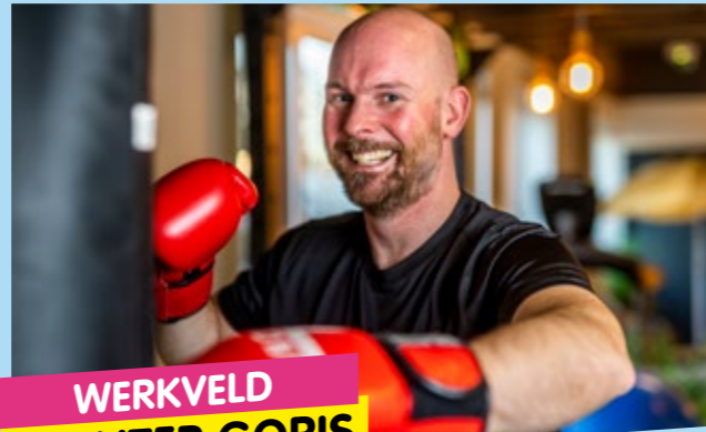
WERKVELD WOUTER GORIS READY2IMPROVE

"De pandemie heeft een momentum gecreëerd voor online oplossingen voor welzijn op en buiten het werk. Digitale oplossingen en e-health tools kunnen werkgevers en welzijnscoaches namelijk helpen om meer op maat van hun werknemers te werken en gezondheidsdata optimaal te benutten. Toegang tot online oplossingen is echter maar een deel van het antwoord. Organisaties moeten op zoek naar de juiste balans tussen technologie en de menselijke touch. Dat is waar gespecialiseerde opleidingen zoals de banaba e-health op het toneel verschijnen. E-health professionals met een grondige kennis van digitale oplossingen, gezondheid en welzijn zullen een zeer waardevolle troef worden waarnaar bedrijven op korte en middellange termijn op zoek zullen gaan."